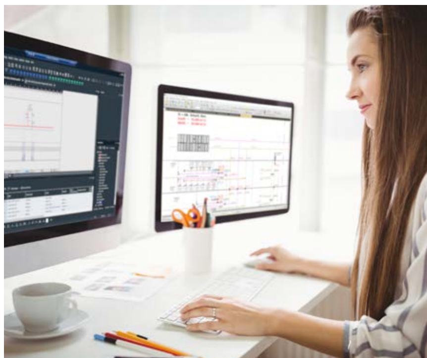
Über den Projekt-Explorer werden Bibliotheken zentral gepflegt und erweitert. Key-User arbeiten Anforderungen aus den Projekten in die Datenbank ein.

zialisten vergleichen die technischen Daten mit den Anforderungen aus der Planung der gewünschten Gebäudeautomation und pflegen das Ergebnis entsprechend im WSCAD Projekt ein. Passen die gewählten Kenndaten der Pumpen, Ventile und Temperaturfühler mit den Anforderungen der geplanten Automatisierung zusammen, gibt es grünes Licht für die Umsetzung.