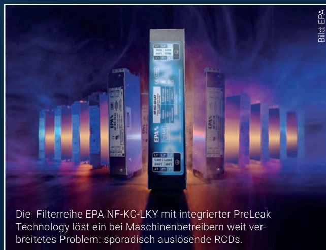
Die Filterreihe EPA NF-KC-LKY mit integrierter PreLeak Technology löst ein bei Maschinenbetreibern weit verbreitetes Problem: sporadisch auslösende RCDs.

und KX einen eigenen Platz in der Eplan Cloud. Über einen QR-Code am Schaltschrank kann der Besitzer der ePocket auf die Maschinen- und Anlagendokumentation inklusive digitalem Zwilling in der Eplan Cloud zugreifen. Mitarbeiter in Service und Instandhaltung greifen über die integrierte Lösung Eplan eView Free direkt an der Anlage Tablet auf die stets aktuellen Schaltpläne zu. Das sichert im Fall der Instandsetzung eine schnelle Auffindbarkeit und schnelle Fehlerbehebung. Der digitale Prozess von Schaltplanerstellung bis Instandhaltung bringt schnelle, korrekte Ergebnisse im Engineering und sorgt mit ePocket für mehr Nachhaltigkeit und Zuverlässigkeit im Betrieb der Anlagen. Damit schafft ePocket nicht nur umweltfreundlich das Papier ab. Der einfache Zugriff auf die aktuellen Daten verschafft Betreibern, Planern, Schaltanlagenbauern und Instandhaltern Vorteile in der Zusammenarbeit. Sie machen damit einen Schritt, um bei den weiter wachsenden Anwendungen im Betrieb und Service von der Datenqualität zu profitieren. Wenn alle Projektdaten, wie Schaltpläne, Wartungspläne, Zertifikate, etc. einer Maschine oder Anlage digital vorhanden sind, lassen